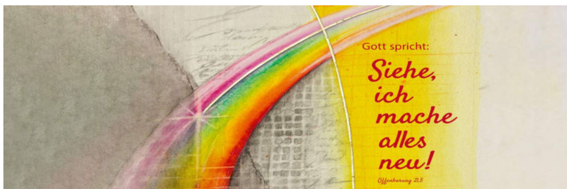
Jahreslosung 2026 Motiv von Stefanie Bahlinger, Mössingen, www.verlagambirnbach.de